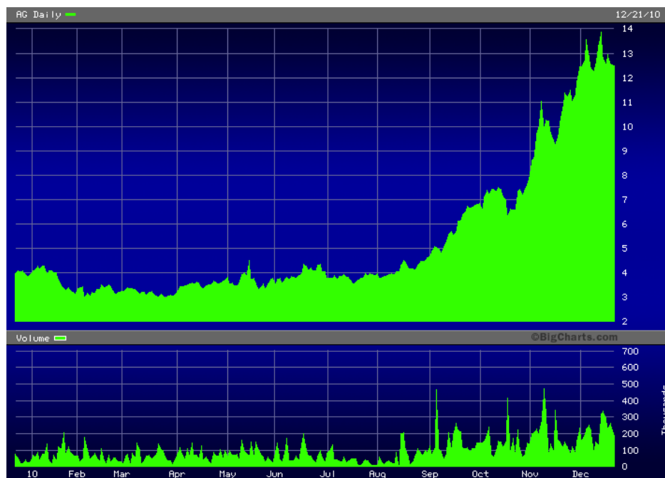
First Majestic Silver 1-Jahreschart

Den aufsteigenden Trend bei Gold und Silber haben viele andere Rohstoffexperten auch erwartet. Aber bei zwei weiteren Trends waren wir im November 2009 mit unseren Empfehlungen noch sehr früh – und das gilt vor allem für den deutschen Markt. Ganz genau handelt es sich hier um Seltene Erden und Lithium. Wie es bei diesen Trends weitergeht und was unsere Favoriten für das kommende Jahr sind, erfahren Sie im Januar 2011 direkt nach der ersten großen Rohstoffmesse des Jahres, die wie immer in Vancouver stattfinden wird.